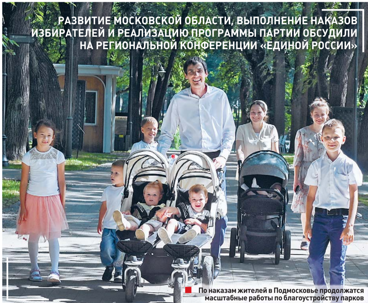
По наказам жителей в Подмосковье продолжатся масштабные работы по благоустройству парков