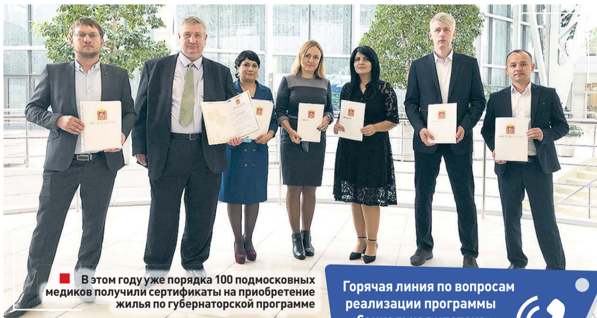
В этом году уже порядка 100 подмосковных медиков получили сертификаты на приобретение жилья по губернаторской программе

которые мы реализуем в рамках президентских программ. Каждый период имеет свои вызовы, и мы претендуем на то, что наша команда способна с ними справиться. Потому что здесь нет человека, которому безразлично. Сила заключается в том, что каждый из нас способен внести лепту в общее дело», – сказал Андрей Воробьёв.